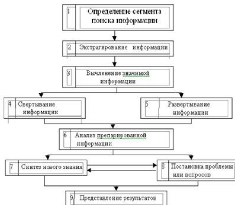
Рис. 2. Блок-схема алгоритма поисковых научных исследований

них аналогичную операцию проводят с систематическим каталогом в выбранной для работы библиотеке. Затем определяют ключевые слова и переход к блоку 2.